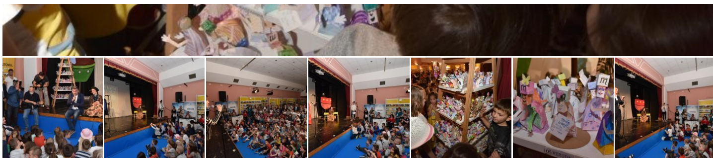
Svečano otvorenje 11. sajma dječje knjige Monte Librić