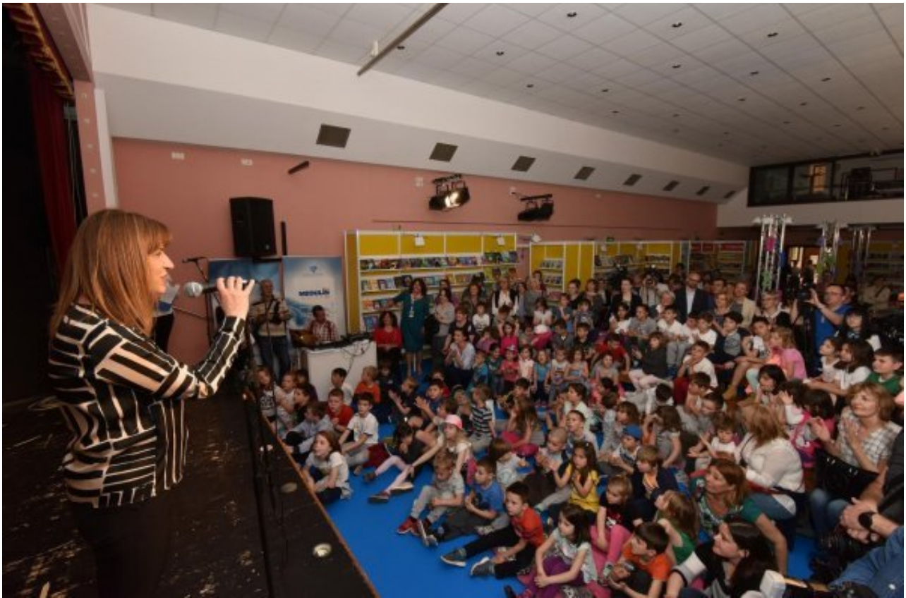
Monte Librić otvoren je u ponedjeljak na Noć knjige