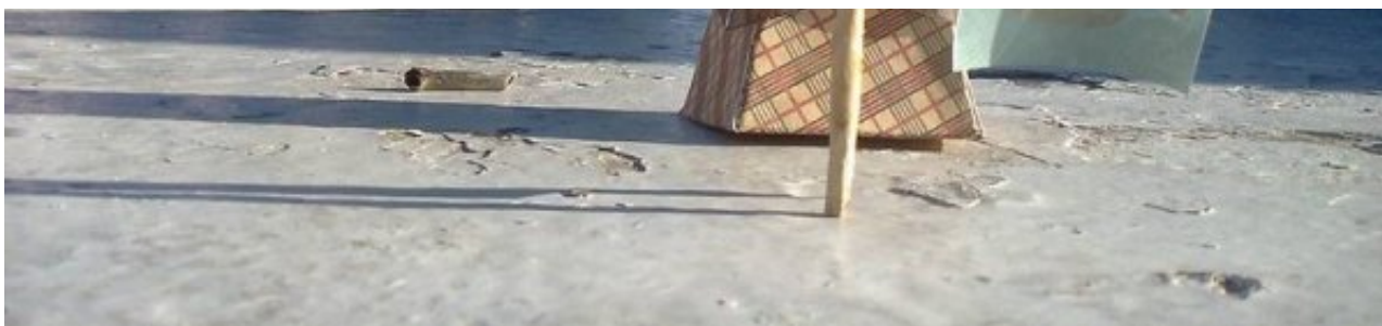
Baka Librić 'javila' se iz dalekog Buenos Airesa