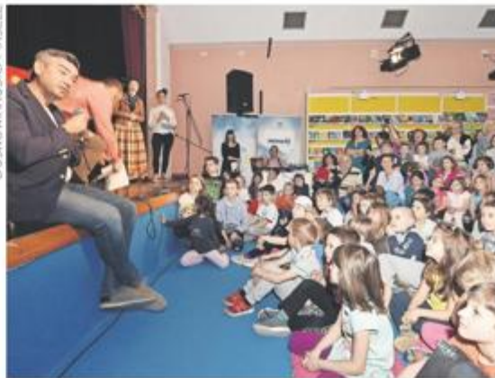
Festival dječje knjige Budućnost knjige ostaje na djeci kojoj je posvećen i jučer u Puli otvoren Festival dječje knjige Monte Librić